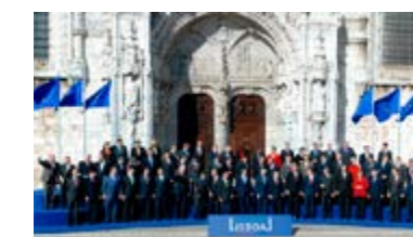
El 13 de desembre de 2007, el Tractat de Lisboa va ser signat pels 27 estats membres a Lisboa

El Tractat de Lisboa va canviar amb èxit la manera de funcionar de les institucions de la UE. Així prendre decisions a escala europea es va fer més fàcil. Les noves normatives van entrar en vigor el desembre del 2009 i encara determinen la manera en què funciona la UE.