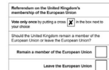
Papereta de votació del referèndum sobre el Brexit, el 23 de juny

El 23 de juny del 2016, a la majoria dels ciutadans del Regne Unit se'ls va plantejar la pregunta següent: «Ha de romandre el Regne Unit com a membre de la Unió Europea o ha d'abandonar la Unió Europea?». Un 51,99% va votar a favor d'abandonar-la i un 48,1% va votar a favor de seguir-hi, cosa que va donar lloc a les negociacions per abandonar la Unió Europea i va fer que es convertís en el primer país en abandonar-la.