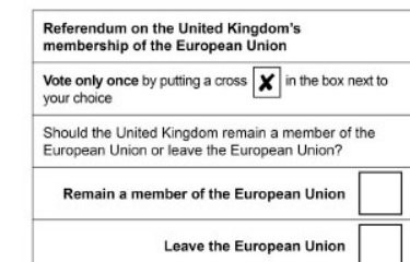
Papeleta de votación del referéndum sobre el Brexit, el 23 de junio.

El 23 de junio de 2016, a la mayoría de los ciudadanos del Reino Unido se les planteó la siguiente pregunta: «¿Debería el país seguir perteneciendo a la Unión Europea o retirarse de la Unión Europea?». Un 51,9 % votó a favor de retirarse y un 48,1 % votó a favor de seguir, lo que dio lugar a las negociaciones para su retirada de la Unión Europea e hizo que se convirtiese en el primer país en abandonar la UE.