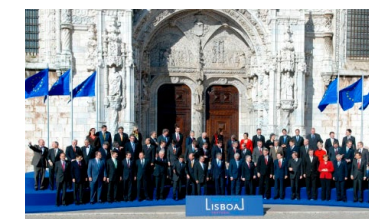
El 13 de diciembre de 2007, el Tratado de Lisboa fue firmado por los 27 Estados miembros en Lisboa

El Tratado de Lisboa cambió con éxito el modo de funcionar de las instituciones de la UE. Tomar decisiones a escala europea se hizo más fácil. Las nuevas normativas entraron en vigor en diciembre de 2009 y todavía determinan el modo en el que funciona la UE.