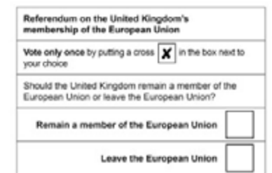
Brexit-ari buruzko erreferendumeko boto-papera, ekainaren 23koa

2016ko ekainaren 23an, Erresuma Batuko herritar gehienek galdera hau egin zieten: «Herrialdeak Europar Batasunean geratu ala Europar Batasunetik irteten beharko luke?». % 51,9k irteteari alde bozkatu zuten, eta % 48,1ek, berriz, geratzearen alde. Horren ondorioz, Europar Batasunetik irteteko negoziazioak hasi ziren eta Batasuna utzi duen lehen herrialdea bihurtu zen.