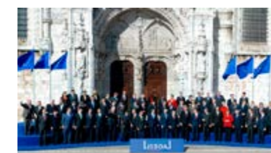
2007ko abenduaren 13an, 27 estatu kideek Lisboako Tratatua sinatu zuten, Lisboan

Lisboako Tratatua arrakastaz aldatu zuen EBko erakundearen aritzeko modua. Europa mailan erabakiak hartzeko prozesua erraztu egin zen. Araudi berriak 2009ko abenduaren sartu ziren indarrean eta EB aritzen den modua zehazten dute oraindik ere.