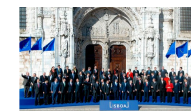
Den 13. deцемber 2007 blev Lissabontraktaten undertegnet af de 27 medlemsstater i Lissabon

Nuair a tháinig Conradh Liospóin isteach, tháinig athrú ar an gcaoi a bhfeidhmíonn institiúidí an Aontais. Bhí sé níos fusa cinntí a dhéanamh ar an leibhéal Eorpach. Tháinig na rialacha nua i bhfeidhm i mí na Nollag 2009 agus is iad atá in úsáid fós san Aontas Eorpach.