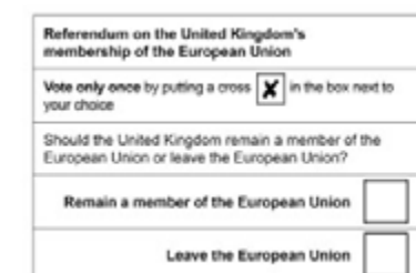
Papeleta de votación do referendo sobre o Brexit, o 23 de xuño.

O 23 de xuño de 2016 á maioría dos cidadáns do Reino Unido formulóuselles a seguinte pregunta: «Debería o país seguir pertencendo a Unión Europea ou retirarse da Unión Europea?». Un 51,9 % votou a favor de retirarse e un 48,1 % votou a favor de seguir, o cal deu lugar ás negociacións para a retirada do Reino Unido da Unión Europea, co resultado de que se converteuse no primeiro país en abandonala.