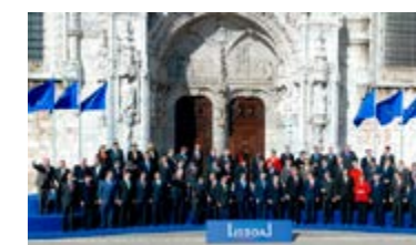
O 13 de decembro de 2007, o Tratado de Lisboa foi asinado polos 27 Estados membros en Lisboa © European Communities 2007.

O Tratado de Lisboa cambiou con éxito o modo de funcionar das institucións da UE. Tomar decisións a escala europea fíxose máis doado. As novas normativas entraron en vigor en decembro do 2009 e aínda determinan o xeito en que funciona a UE.