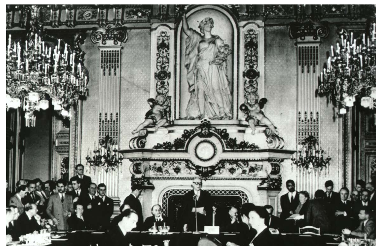
A SCHUMAN-NYILATKOZATI