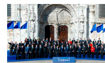
2007. december 13-án Lisszabonban 27 tagállam aláírta a Lisszaboni Szerződést.

A Lisszaboni Szerződésnek sikerült megváltoztatnia az uniós intézmények működését. Az uniós szintű döntéshozatal egyszerűbbé vált. Az új szabályok 2009 decemberében léptek hatályba, és a mai napig meghatározzák az EU működését.