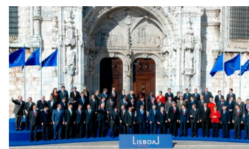
2007. gada 13. decembrī Lisabonā 27 dalībvalstis parakstīja Lisabonas līgumu.

Lisabonas līgums veiksmīgi pavēra iespēju mainīt ES iestāžu darbības principus. Pieņemot ES līmeņa lēmumus kļuva vienkāršāk. Jaunie noteikumi stājās spēkā 2009. gada decembrī un joprojām nosaka, kā darbojas Eiropas Savienība.