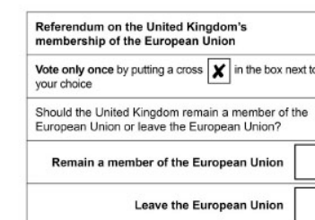
Glasovnica na referendumu o brexitu 23. junija 2016.

Večina britanskih državljanov in nekateri drugi prebivalci Združenega kraljestva so 23. junija 2016 glasovali o vprašanju: „Ali naj Združeno kraljestvo ostane članica Evropske unije ali naj Evropsko unijo zapusti?“ 51,9 % ljudi je glasovalo za „zapusti“, 48,1 % pa za „ostane“, zato se je Združeno kraljestvo kot prva država, ki je želela oditi, začelo pogajati o izstopu iz Evropske unije.