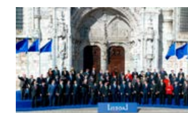
Den 13 december 2007 undertecknades Lissabonfördraget av de 27 medlemsstaterna i Lissabon

Lissabonfördraget ändrade EU-institutionernas sätt att arbeta. Det blev enklare att fatta beslut på EU-nivå. De nya reglerna började gälla i december 2009 och de är fortfarande grunden för hur EU fungerar idag.