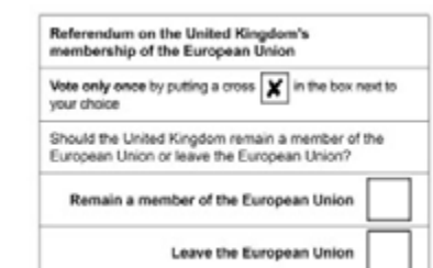
Röstsedel från folkomröstningen om brexit den 23 juni 2016

Den 23 juni 2016 fick de flesta brittiska medborgare och en del andra som var bosatta i Förenade kungariket svara på frågan: "Bör Förenade kungariket vara kvar i EU eller lämna EU?" 51,9 % ville lämna och 48,1 % ville vara kvar. Resultatet innebar att man inledde förhandlingar om Förenade kungarikets utträde, som första land någonsin att lämna EU.