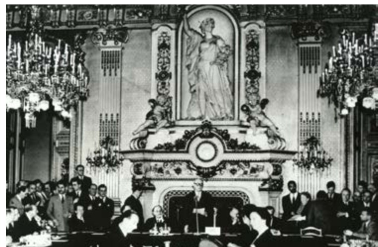
Declaració Schuman