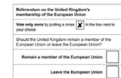
Papereta de votació del referèndum sobre el Brexit, el 23 de juny

El 23 de juny de 2016, a la majoria dels ciutadans del Regne Unit se'ls va plantejar la pregunta següent: «El país hauria de continuar pertanyent a la Unió Europea o hauria d'eixir-se'n?». Un 51,9% va votar a favor d'eixir-se'n i un 48,1% va votar a favor de seguir, cosa que va donar lloc a les negociacions per a la seua retirada de la Unió Europea i va fer que es convertira en el primer país a abandonar-la.