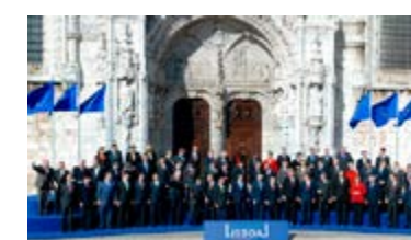
El 13 de desembre de 2007, el Tractat de Lisboa va ser firmat pels 27 Estats membres a Lisboa

El Tractat de Lisboa va canviar amb èxit la manera de funcionar de les institucions de la UE. Prendre decisions a escala europea es va fer més fàcil. Les noves normatives van entrar en vigor al desembre de 2009, i encara determinen la manera en què funciona la UE.