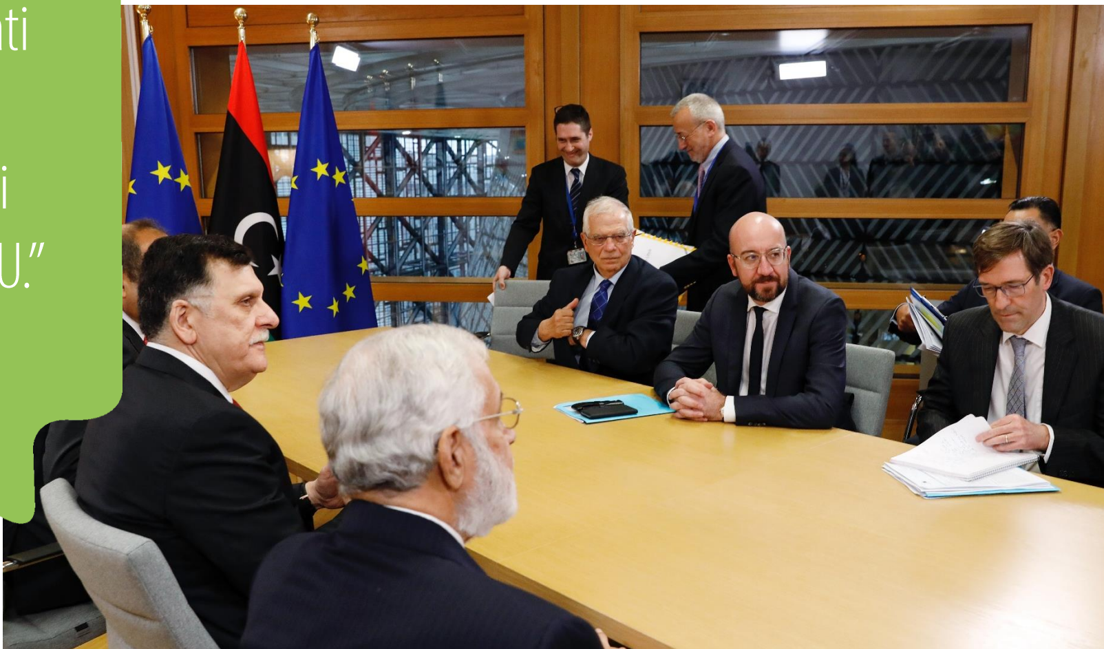
Predsjednik Michel i Josep Borrell sastaju se s premijerom Libije (8. siječnja 2020., Bruxelles)

„EU ne bi trebao poslovati s režimima u kojima se krše ljudska prava, čak ni kad bi to bilo dobro za EU.“