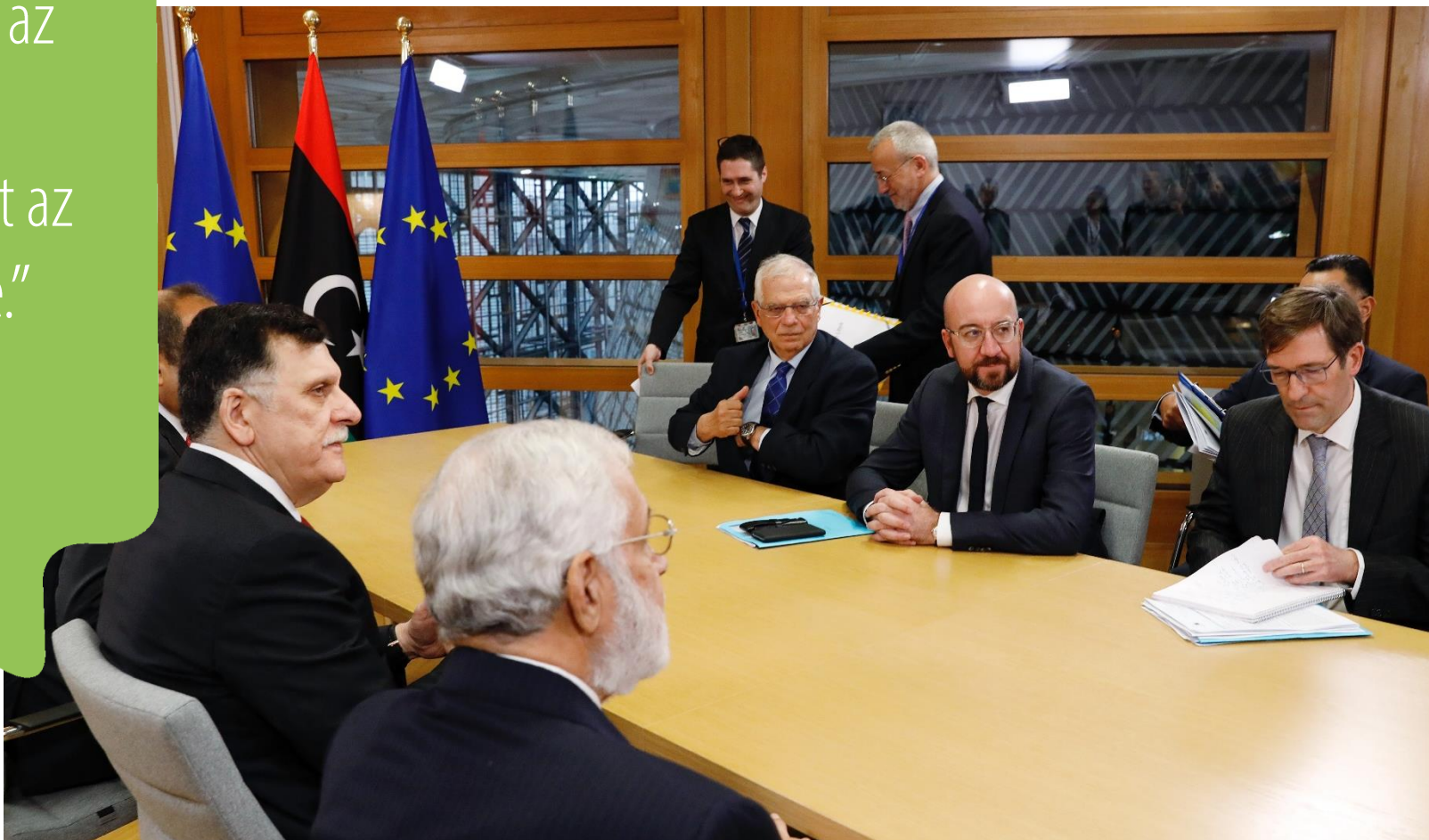
Michel elnök és Josep Borrell találkozik Líbia miniszterelnökével (Brüsszel, 2020.01.08.)

„Az EU-nak nem lenne szabad üzleti kapcsolatokat ápolnia az emberi jogokat megsértő rezsimekkel, még ha az üzlet az EU számára előnyös is lenne.”