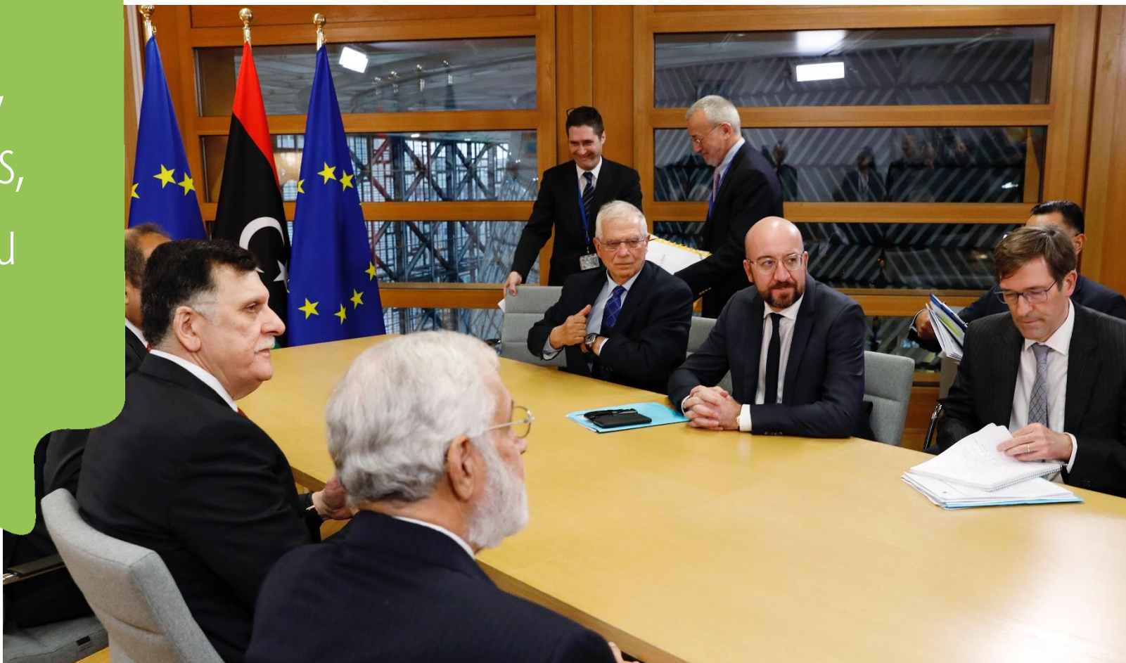
Eiropadomes priekšsēdētājs Š. Mišels un Ž. Borelš tiekas ar Libijas premjerministru (Brisele, 08.01.2020.).

“ES nevajadzētu sadarboties ar režīmiem, kas pārkāpj cilvēktiesības, pat ja šāds darījums dotu labumu ES.”