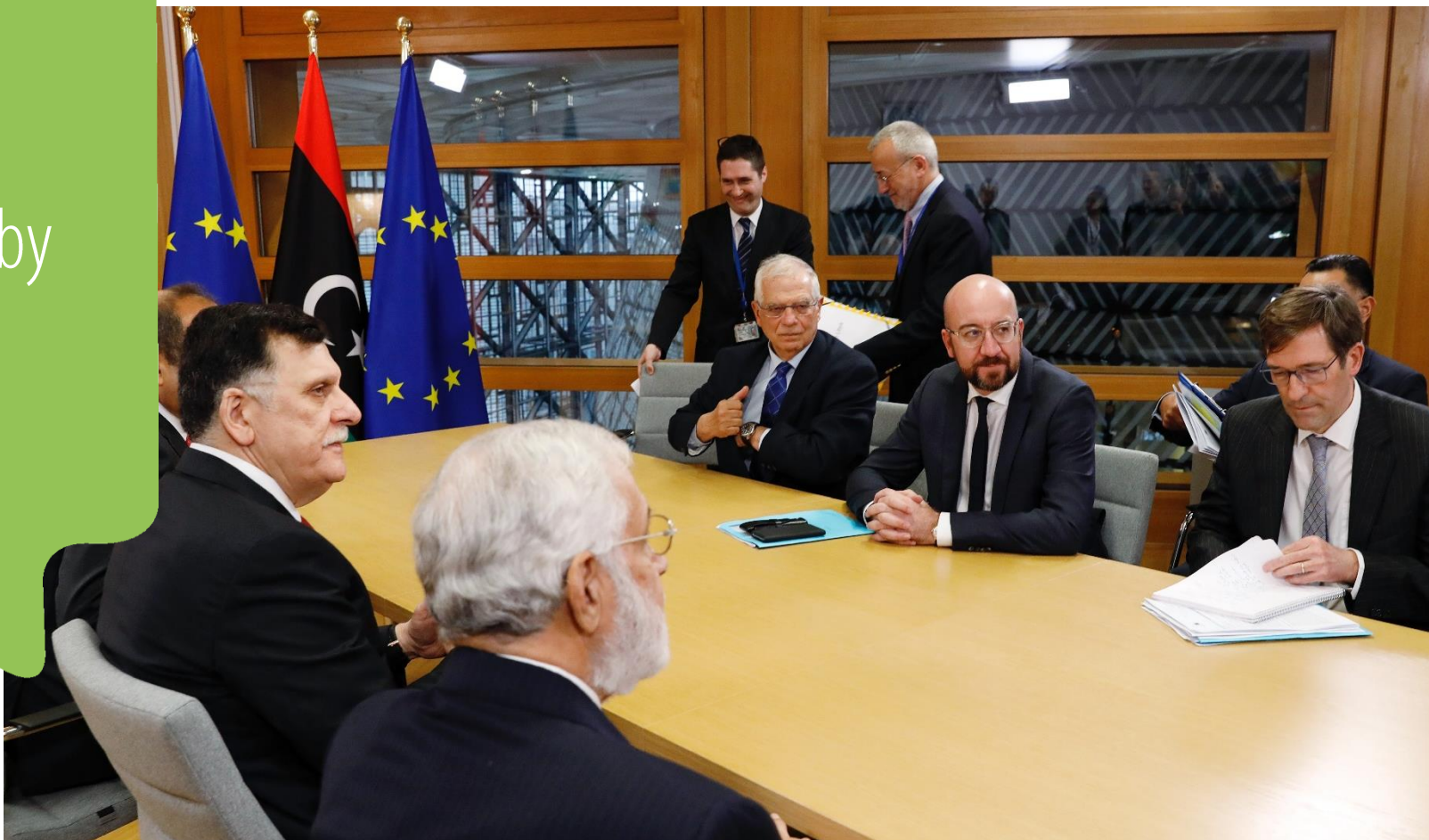
Predseda Rady Charles Michel a Josep Borrell na stretnutí s predsedom líbyjskej vlády (v Bruseli 8. 1. 2020).

„EÚ by nemala obchodovať s režimami, ktoré porušujú ľudské práva, a to ani vtedy, ak by dohoda bola pre EÚ prínosom.“