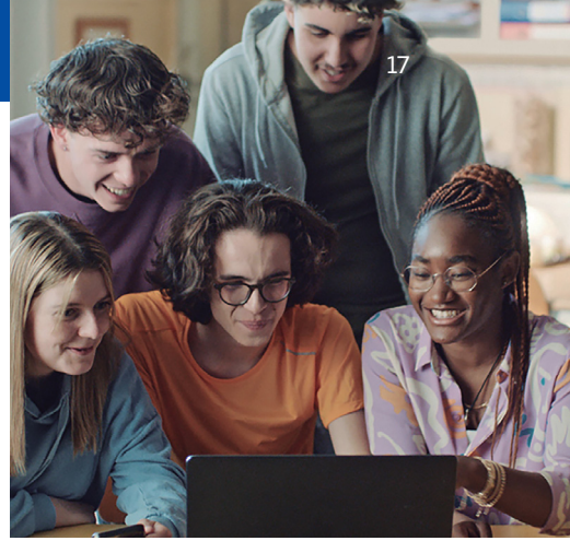
Εικονικό Παιχνίδι Ρόλων

Το Ευρωπαϊκό Κοινοβούλιο είναι το μόνο θεσμικό όργανο της ΕΕ που εκλέγεται άμεσα από τους πολίτες. Κάθε 5 χρόνια, 450 εκατομμύρια Ευρωπαίοι ψηφοφόροι επιλέγουν τους βουλευτές του Ευρωπαϊκού Κοινοβουλίου για να τους εκπροσωπούν. Οι βουλευτές εργάζονται εξ ονόματος των πολιτών, συζητώντας, διαμορφώνοντας και ψηφίζοντας δεσμευτικούς κανόνες για ζητήματα που βρίσκονται στο επίκεντρο της καθημερινής ζωής των ανθρώπων. Το Κοινοβούλιο: