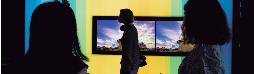
Επισκεψου το Ευρωπαϊκό Κοινοβούλιο