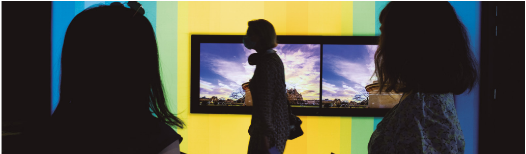
Külasta Euroopa Parlamenti