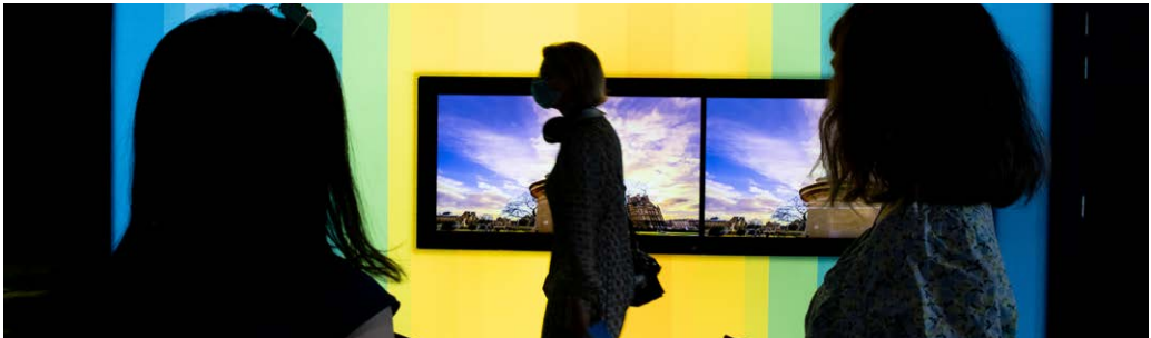
Tabhair cuairt ar Pharlaimint na hEorpa