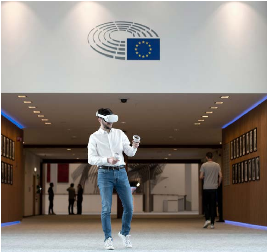
Blaiseadh de shaol an Fheirse

Ina gcuid oibre, caithfidh na Feisirí urraim a thabhairt ar Chód Iompair, lena leagtar síos treoirphrionsabail faoi conas a gcuid oibre a sheoladh le neamh-fhéinchúis, macántacht, oscailteacht, dúthracht, ionracas, cuntasacht agus meas ar dhínit agus ar chlú Parlaimint na hEorpa. Neartaíodh an Cód Iompair in 2023.