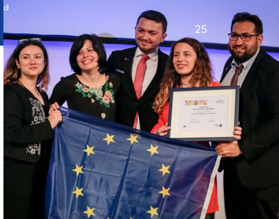
Duais Eorpach Charlemagne don Óige

Is é aidhm an mhodúil dheireanaigh ná smaointe a chur ar fáil do dhaoine óga faoi ghníomhaíochtaí ar féidir leo a dhéanamh chun an chéad chéim i dtreo bheith ina saoránach gníomhach agus na hathruithe atá á lorg uathu a chruthú.