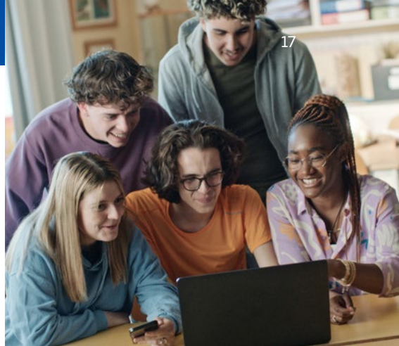
Wirtualna gra fabularna

Parlament Europejski jest jedyną instytucją Unii Europejskiej, którą wybierają bezpośrednio obywatele. Co pięć lat 450 mln Europejczyków wybiera posłów do Parlamentu Europejskiego, którzy będą ich reprezentować. Posłowie pracują w ich imieniu, dyskutują, kształtują i uchwalają przepisy, które mają ważne znaczenie dla codziennego życia ludzi. Parlament Europejski: