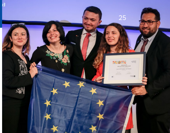
Europejska Nagroda dla Młodzieży im. Karola Wielkiego

Celem ostatniego modułu jest przedstawienie młodym ludziom pomysłów na działania, które mogą podjąć , aby stać się aktywnymi obywatelami i wprowadzić zmiany, na których im zależy.