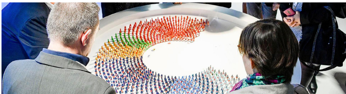
Program Parlamentu Europejskiego „Szkoła-Ambasador” (EPAS)