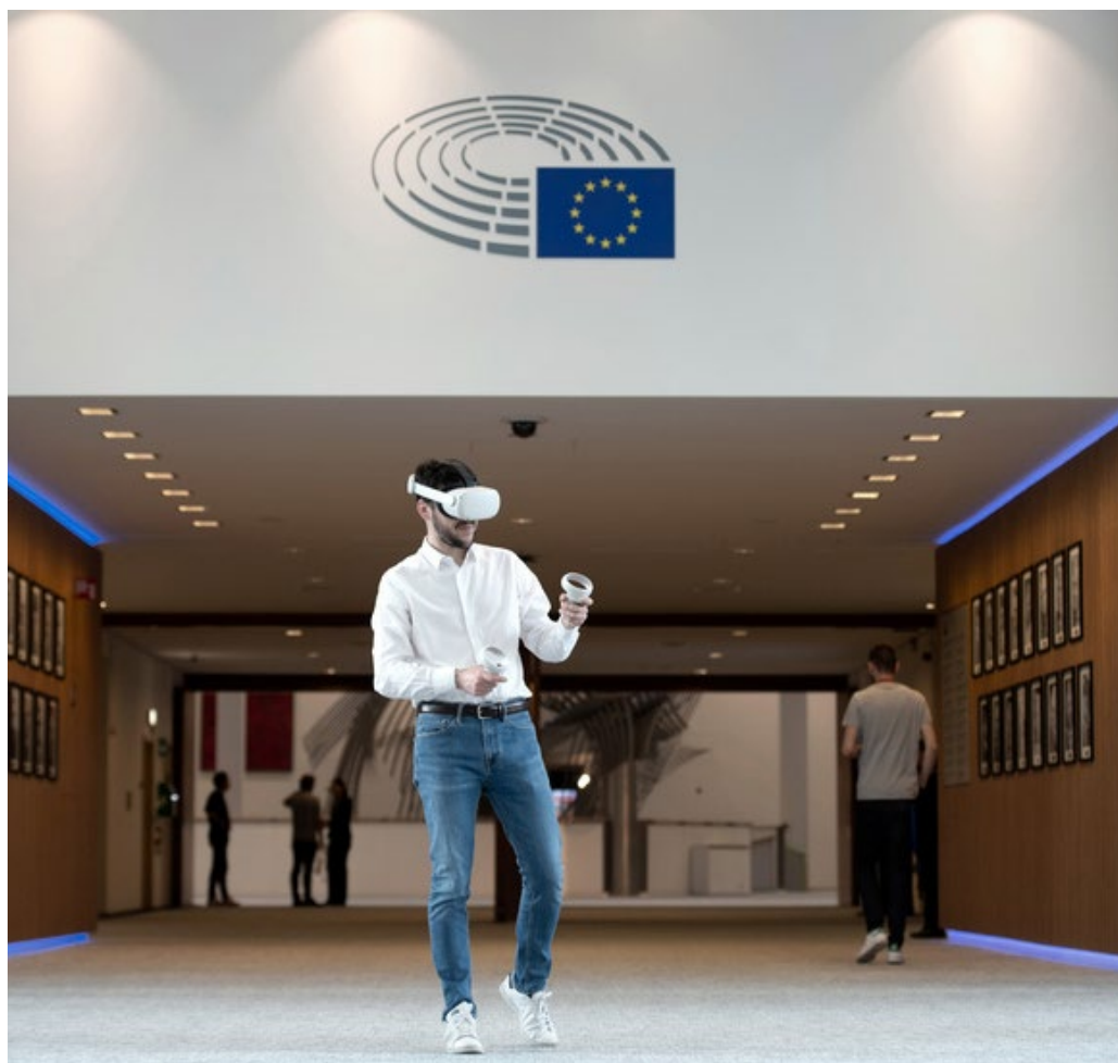
Бъдете член на ЕП

При работата си членовете на ЕП трябва да спазват Кодекс на поведение, в който са определени водещите принципи за това как да вършат работата си безкористно, почтено, открито, усърдно, честно, отговорно и при зачитане на репутацията и престижа на Европейския парламент. Кодексът на поведение беше подсилен през 2023 г.