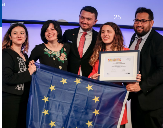
Европейска младежка награда „Карл Велики“

Целта на последния модул е да даде на младите хора идеи за действия, които те могат да предприемат , за да направят първата стъпка към това да станат активни граждани и да създадат промяната, която искат да видят.