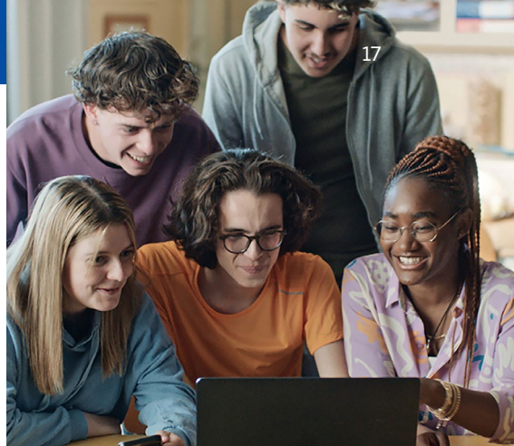
Виртуална ролева игра

Европейският парламент е единственият пряко избран орган на ЕС. На всеки 5 години 450 милиона гласоподаватели от Европа избират членовете на Европейския парламент, които да ги представляват. Членовете работят от тяхно име, като обсъждат, оформят и приемат закони по въпроси от основно значение за ежедневието на хората. Парламентът: