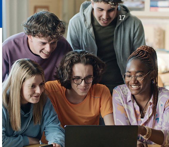
Virtuālā lomu spēle

Eiropas Parlaments ir vienīgā tieši ievēlētā Eiropas Savienības iestāde. Ik pēc pieciem gadiem 450 miljoni Eiropas vēlētāju izraugās Eiropas Parlamenta (EP) deputātus, kas viņus pārstāvēs. Deputāti strādā vēlētāju vārdā, apspriežot, veidojot un pieņemot tiesību aktus par jautājumiem, kas ir svarīgi cilvēku ikdienas dzīvē. Parlaments: