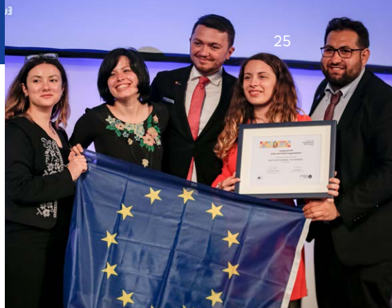
Europos Karolio Didžiojo jaunimo premija

Paskutinio modulio tikslas – suteikti jaunimui idėjų, kokių veiksmų jie gali imtis , kad žengtų pirmąjį žingsnį, taptų aktyviais piliečiais ir pasiektų norimų pokyčių.