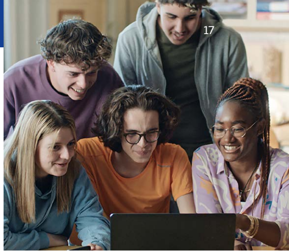
Virtualus vaidmenų žaidimas

Europos Parlamentas yra vienintelė tiesiogiai renkama ES institucija. Kas penkerius metus 450 mln. europiečių renka jiems atstovausiančius Europos Parlamento narius. Nariai dirba jų vardu, diskutuodami, formuodami ir priimdami teisės aktus kasdieniam žmonių gyvenimui svarbiais klausimais. Parlamentas: