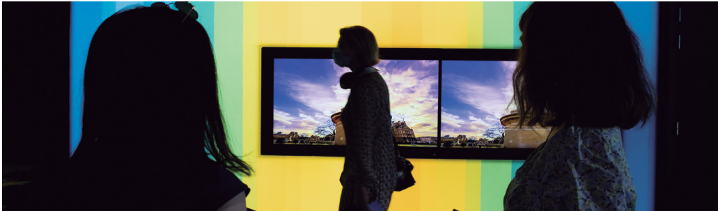
Het Europees Parlement bezoeken