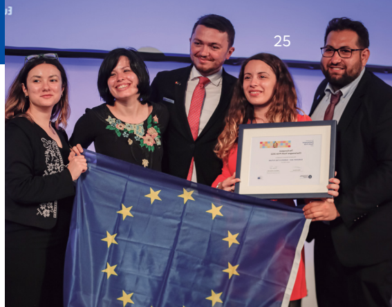
Europese Karel de Grote-prijs voor jongeren

Het doel van de laatste module is jongeren ideeën te geven over hoe ze in actie kunnen komen en een eerste stap kunnen zetten in de richting van actief burgerschap, zodat ze hun steentje kunnen bijdragen aan de verandering die zij willen zien.