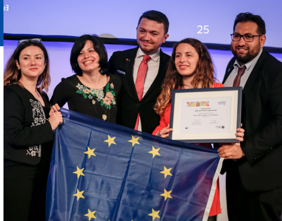
Evropska mladinska nagrada Karla Velikega

Namen zadnjega modula je mladim ponuditi ideje o načinih udejstvovanja, ki so jim na voljo kot prvi korak k temu, da bi postali aktivni državljani in ustvarili spremembe, ki si jih želijo.