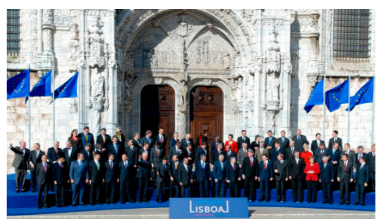
2007. december 13-án Lisszabonban 27 tagállam aláírta a Lisszaboni Szerződést.

A Lisszaboni Szerződésnek sikerült megváltoztatnia az uniós intézmények működését. Az uniós szintű döntéshozatal egyszerűbbé vált. Az új szabályok 2009 decemberében léptek hatályba, és a mai napig meghatározzák az EU működését.