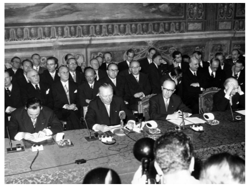
Kép: A Római Szerződés aláírása © AP, 1957 - Source EC Audiovisual Service.

Arra gondolt, hogy ez az együttműködés a jövőbeli háborúk elkerülésének záloga lehet, hiszen a szén és az acél a fegyvergyártás szükséges alapanyagai. Ezenfelül a szén és az acél a kontinens háború utáni újjáépítésében is igen fontos szerepet játszott.