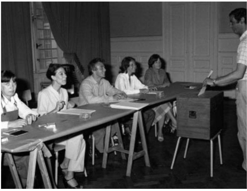
Belgiumi szavazóroda az európai választásokon

A Római Szerződés 1958-ban léptek hatályba.