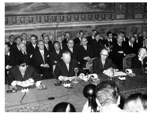
Obrázok: Podpísanie Rímskych zmlúv © AP, 1957 – Source EC Audiovisual Service.

Keďže uhlie a oceľ sú nevyhnutnými zložkami na výrobu zbraní, dúfal, že táto spolupráca znemožní budúcu vojnu. Navyše, uhlie a oceľ boli veľmi dôležité aj pre obnovu kontinentu po vojne.