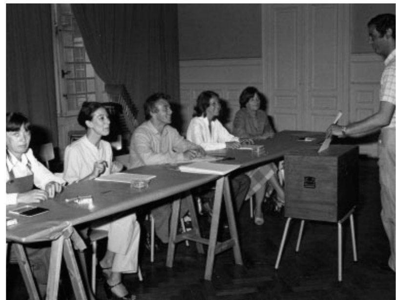
Volebná miestnosť v európskych voľbách, Belgicko

Rímske zmluvy nadobudli platnosť v roku 1958.