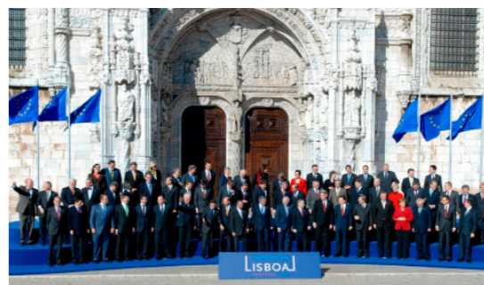
Lisabonskú zmluvu podpísalo 13. decembra 2007 v Lisabone 27 členských štátov

Lisabonskou zmluvou sa podarilo zmeniť fungovanie inštitúcií EÚ. Rozhodovanie na európskej úrovni sa zjednodušilo. Nové pravidlá sú platné od decembra 2009 a podľa nich funguje EÚ dodnes.