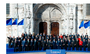
Den 13. december 2007 blev Lissabontraktaten undertegnet af de 27 medlemsstater i Lissabon

Med Lissabontraktaten lykkedes det at ændre EU-institutionernes funktionsmåde. Det blev lettere at træffe beslutninger på EU-plan. De nye regler trådte i kraft i december 2009, og de bestemmer stadig den dag i dag, hvordan EU fungerer.