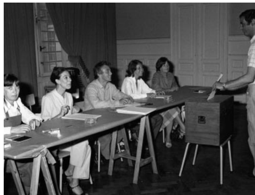
Ured za ispitivanje javnog mnijenja na europskim izborima, Belgija

Robert Schuman, francuski ministar vanjskih poslova, 9. svibnja 1950. održao je konferenciju za tisak. Pozvao je ostale europske zemlje da udruže svoje izvore ugljena i čelika. Budući da su ugljen i čelik potrebni za proizvodnju oružja, smatrao je da bi se tom suradnjom onemogućilo daljnje ratovanje. Usto, ugljen i čelik bili su vrlo važni i za izgradnju kontinenta nakon rata.