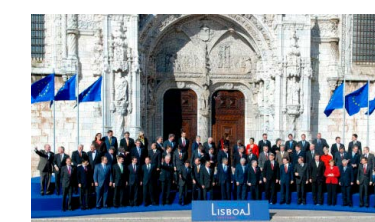
U Lisabonu je 13. prosinca 2007. Ugovor iz Lisabona potpisalo 27 država članica.

Lisabonski ugovor promijenio je način na koji institucije EU-a funkcioniraju. Donošenje odluka na razini EU-a postalo je lakše. Nova pravila koja su stupila na snagu u prosincu 2009. još uvijek određuju način na koji EU funkcionira.