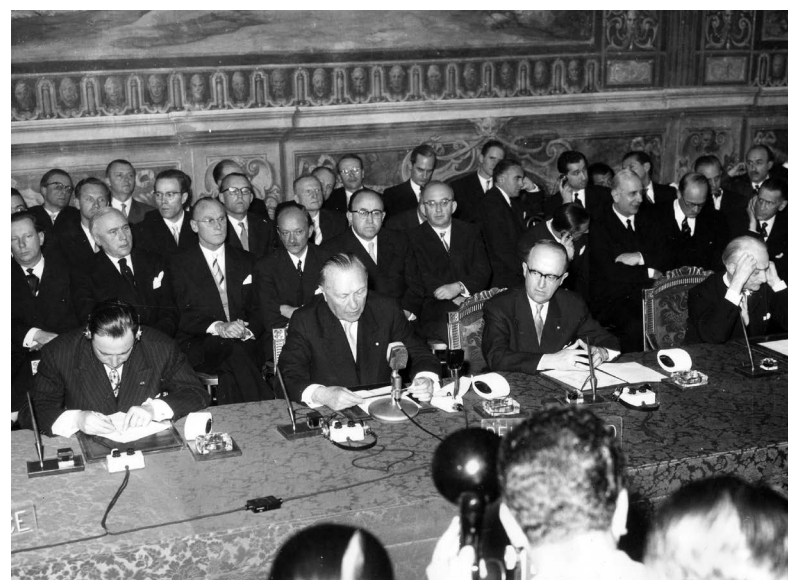
Fotografija: Potpisivanje Ugovorâ iz Rima. © AP, 1957 – Source EC Audiovisual Service.

Ugovori iz Rima stupili su na snagu 1958. godine.