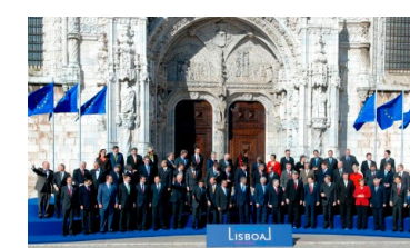
2007 m. gruodžio 13 d. Lisabonos sutartį Lisabonoje pasirašė 27 valstybių narių atstovai.

Lisabonos sutartimi pavyko pakeisti tai, kaip veikia ES institucijos. Priimti sprendimus ES lygmeniu tapo paprasčiau. Naujosios taisyklės įsigaliojo 2009 m. gruodį. Jomis ir šiandien apibrėžiamas ES veikimas.