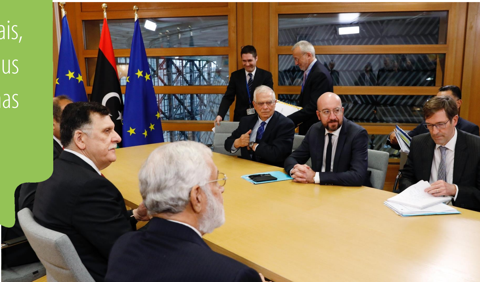
Pirmininkas Ch. Michelis ir J. Borrellis susitinka su Libijos Ministru Pirmininku (2020 m. sausio 8 d., Briuselis)

„ES neturėtų palaikyti verslo santykių su režimais, kurie pažeidinėja žmogaus teises, netgi jei susitarimas būtų naudingas ES“.