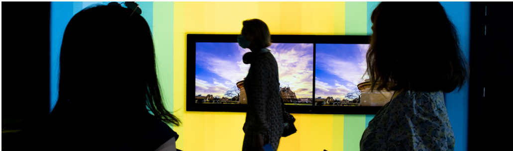
Tabhair cuairt ar Pharlaimint na hEorpa