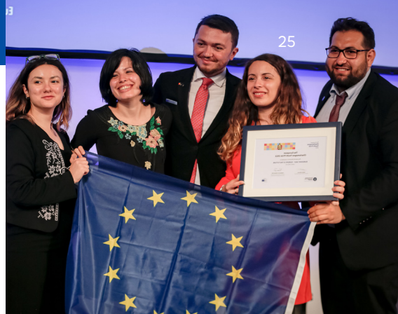
Duais Eorpach Charlemagne don Óige

Is é aidhm an mhodúil dheireanaigh ná smaointe a chur ar fáil do dhaoine óga faoi ghníomhaíochtaí ar féidir leo a dhéanamh chun an chéad chéim i dtreo bheith ina saoránach gníomhach agus na hathruithe atá á lorg uathu a chruthú.